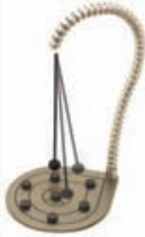
Şekil 2: 7 mıknatıslı manyetik sarkaç