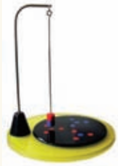
Şekil 3: 12 mıknatıslı manyetik sarkaç

Mıknatıs olarak çapı 20 mm, kalınlığı 10 mm olan ferrit tipte mıknatıslar kullanılabilir. Bu mıknatıslar 300 oksit olarak da adlandırılıyor. Ülkemizde mıknatıs satışı yapan pek çok firma bulunduğu için, mıknatıs temin etmek artık sorun oluşturmuyor. Firma isimlerine ulaşmak için, internette google arama motoruna girip mıknatıs kelimesini aramak yeterli. Projede kullanılacak mıknatıs sayısı isteğe göre seçilebilir. 4, 7, 9 adet veya daha fazla sayıda mıknatıs kullanmak mümkün. Ferrit mıknatıs yerine neodyum mıknatıs da tercih edilebilir.