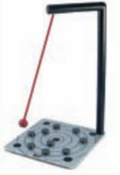
Şekil 1: 9 mıknatıslı manyetik sarkaç

Manyetik sarkaç, sıradan sarkaçlardan farklı bir özelliğe sahip. Sarkaç, sağa-sola tekdüze bir salınım hareketi yapmak yerine, farklı doğrultularda rastgele hareketler yapıyor. İşin ilginç yanı, bu hareketin önceden tahmin edilemeyecek kadar karmaşık oluşu. Sarkacın ucundaki mıknatıs ile taban kısmında yer alan mıknatısların manyetik etkileşimi sayesinde böyle bir sonuç ortaya çıkıyor. Manyetik sarkaçlar piyasada hazır olarak satılmakta. Şekil 1-3'de sarkaç örnekleri görülüyor. Bu yazıda benzer bir tasarımdan bahsedilecek.