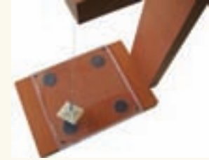
Şekil 9: Manyetik sarkaç

Sarkacın tamamlanmış hali şekil 9'da görülüyor. Mıknatısların zarar görmemesi için üzerlerine CD kutusunun şeffaf kapağı vidalanmıştır.