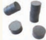
Şekil 4: Ferrit mıknatıslar

Mıknatıs olarak çapı 20 mm, kalınlığı 10 mm olan ferrit tipte mıknatıslar kullanılabilir. Bu mıknatıslar 300 oksit olarak da adlandırılıyor. Ülkemizde mıknatıs satışı yapan pek çok firma bulunduğu için, mıknatıs temin etmek artık sorun oluşturmuyor. Firma isimlerine ulaşmak için, internette google arama motoruna girip mıknatıs kelimesini aramak yeterli. Projede kullanılacak mıknatıs sayısı isteğe göre seçilebilir. 4, 7, 9 adet veya daha fazla sayıda mıknatıs kullanmak mümkün. Ferrit mıknatıs yerine neodyum mıknatıs da tercih edilebilir.