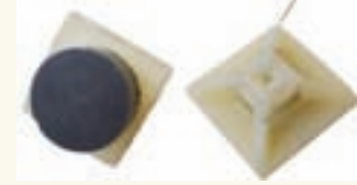
Şekil 8: Yapışkan kroşe

İpi mıknatısa bağlamada kolaylık sağlaması için yapışkan kroşe olarak bilinen malzeme kullanılabilir. Böylece mıknatıs sağlam şekilde ipe tutturulmuş olur.